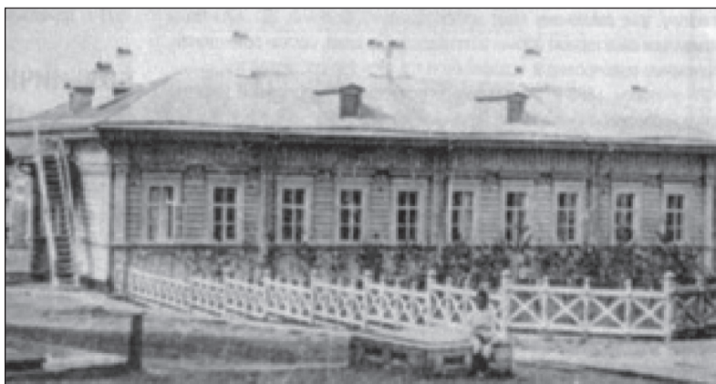
Павильон для заразных больных.