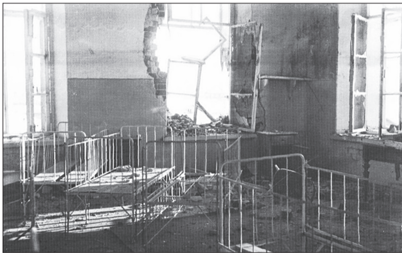
Во время декабрьских боёв 1919 года детская больница подвергалась обстрелу.