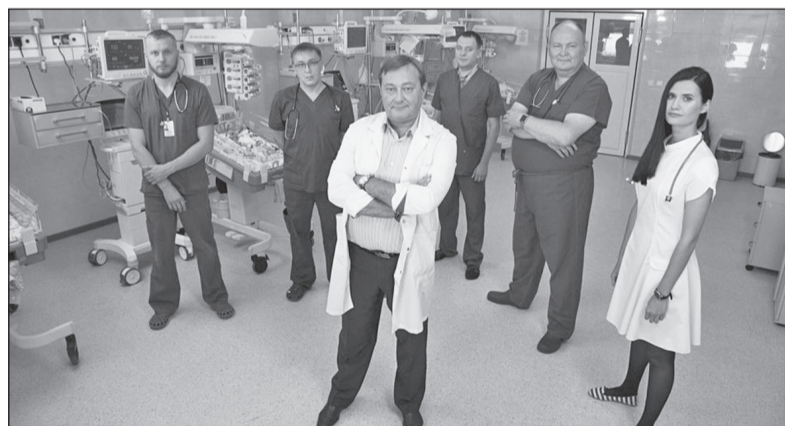
В 2017 году о хирургах Ивано-Матрёнинской детской больницы команда Discovery сняла сериал «Спасая младенцев»

троля качества, сродни системам на железной дороге и в авиации, благодаря которым поезда идут, а самолёты не сталкиваются в небе. Согласитесь — удобно, когда на смартфоне можно увидеть, какой доктор сегодня принимает, на какое время, к какому врачу лучше записаться, где он находится, и так далее. Система поможет выстроить логистику и для пациентов, и для докторов.