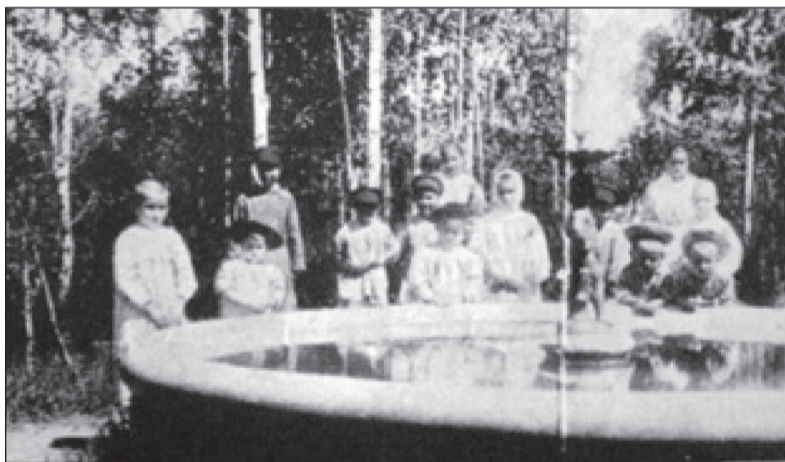
Бассейн во дворе больницы 20—30-е гг. XX в.

Название больницы — Ивано-Матрёнинская — утвердил 2 января 1897 года император Николай II